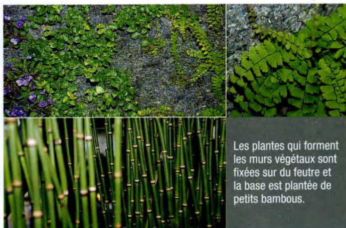
Les plantes qui forment les murs végétaux sont fixées sur du feutre et la base est plantée de petits bambous.

carrés. Ils apportent un élément vivant à un espace intérieur dont la belle architecture est dépouillée. Les plantes amusent les vendeuses, étonnent ou enchantent les clientes, mais passent rarement inaperçues.